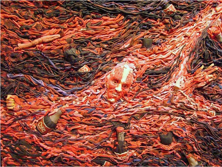
Plastilina sobre madera: "Rio Rojo".