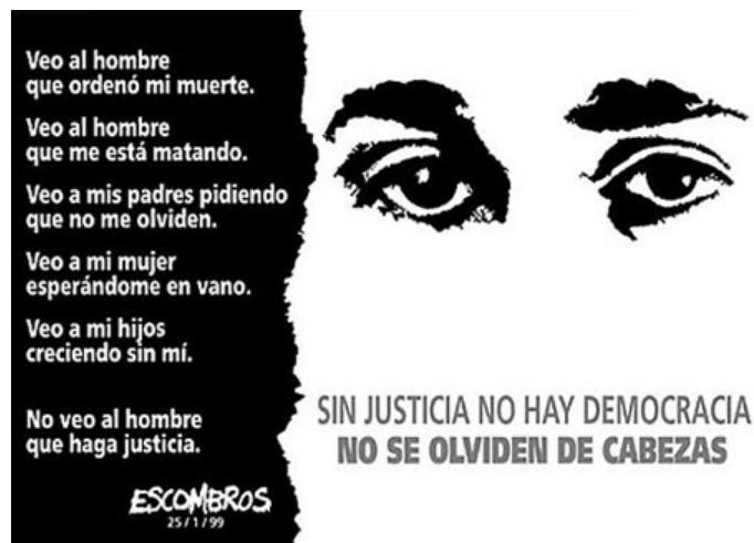
Afiche: “La mirada de José Luis”.

Utilizan todo tipo de medio de comunicación posible para la realización de sus obras, como por ejemplo: instalaciones, manifestaciones, murales, objetos, afiches, poemas, grabados, graffitis, etc.