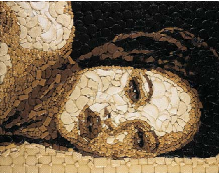
Galletitas dulces sobre madera: "Despertar".