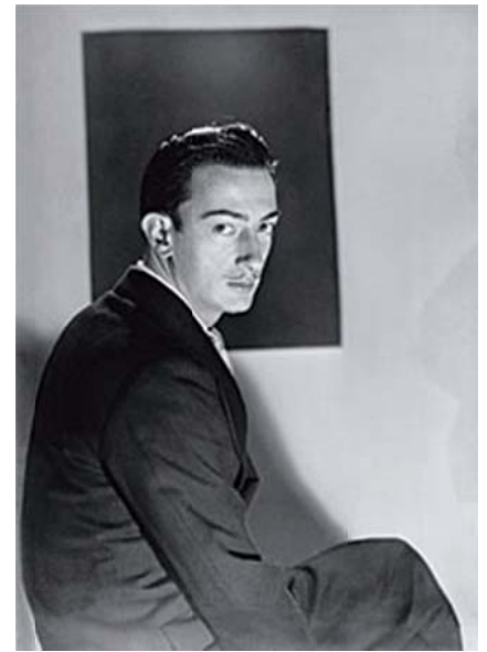
Dalí por Man Ray