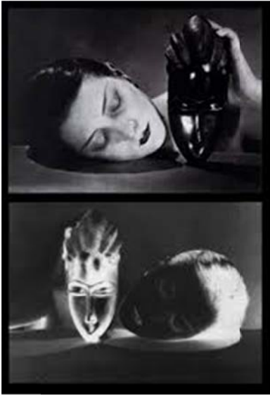
Imagen blanco y negro, y solarización, de tinte surrealista. Se incluye máscara africana que remite a las búsquedas vanguardistas interesadas en el primitivismo de la forma. Especialmente el Cubismo y el Expresionismo.