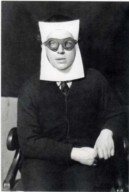
Breton por Man Ray