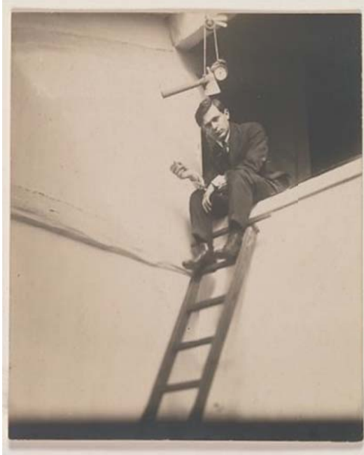
Tzara