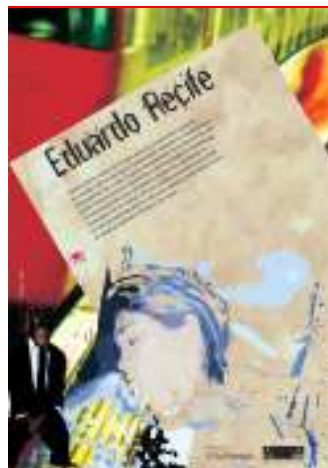
(FIG.9 e 10)