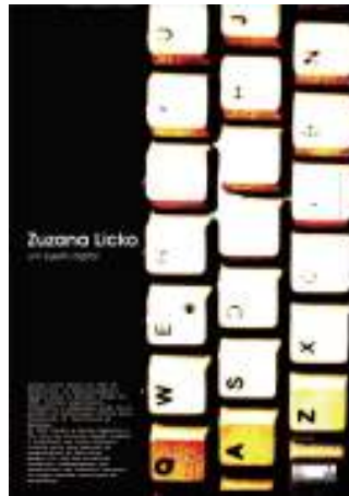
(FIG.7 e 8)