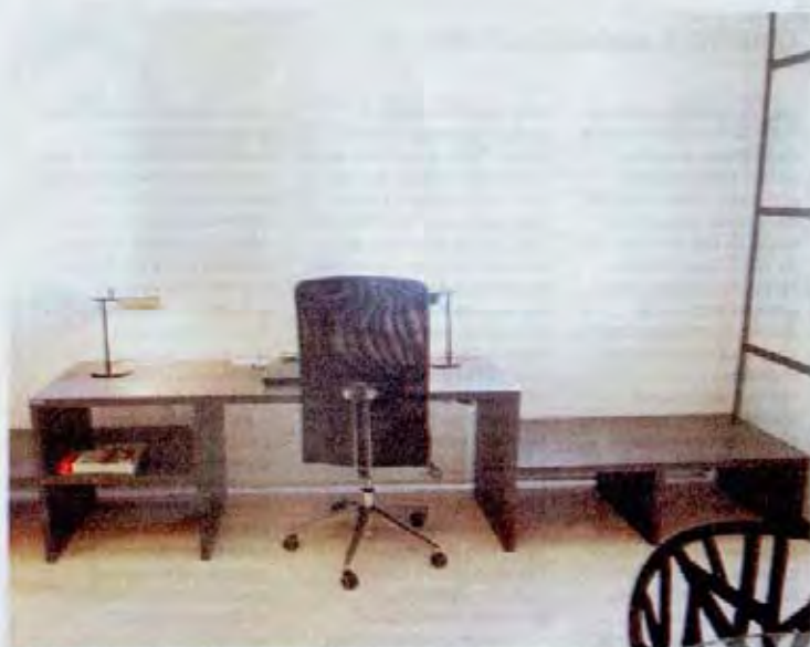
Escritorio. Contra la ventana que da a un patio interior. También cumple la función de banco.