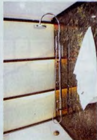
Ducha. Plato de ducha opening (Roca).