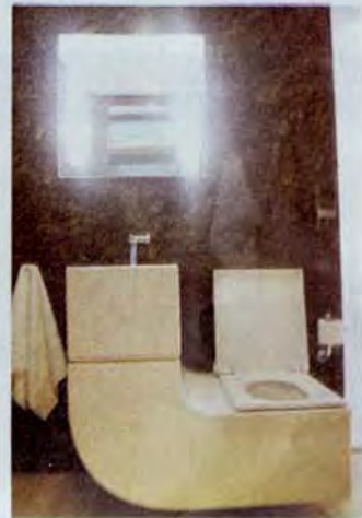
En L. Sanitario que reutiliza el agua.