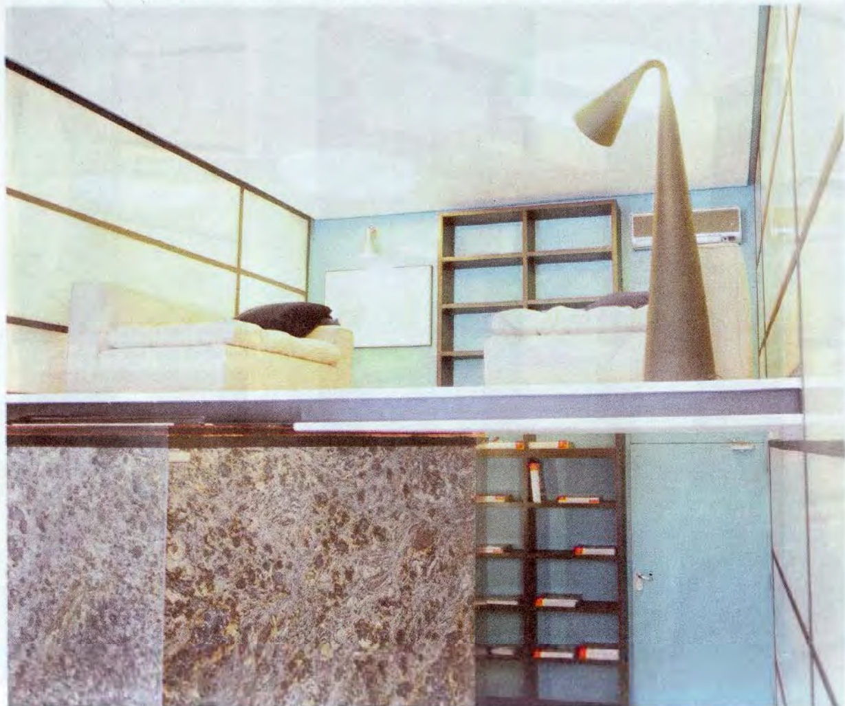
Entrepiso. Es el espacio de descanso, archivo y lectura al que se accede por una escalera de mano plegable.