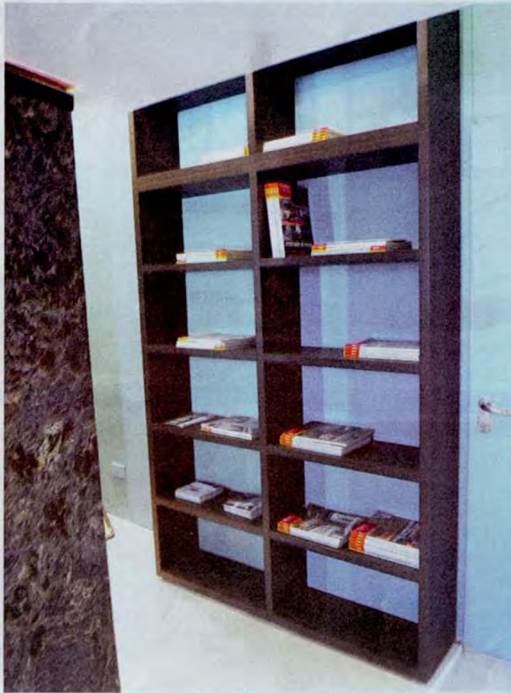
Biblioteca. Contrasta con la textura de los pisos y el granito negro (1,45 x 0,29 x 2 m)