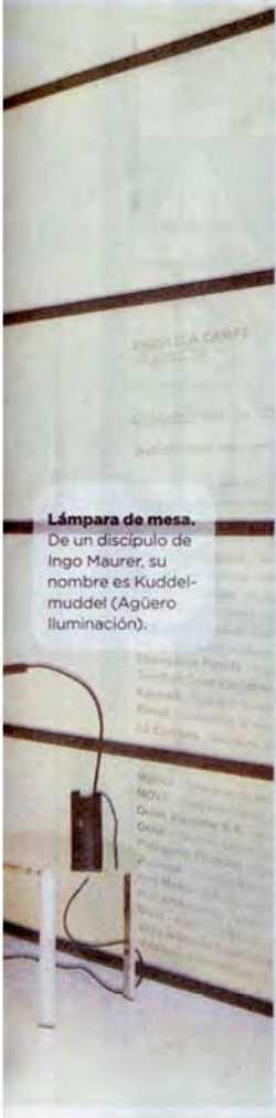
Lámpara de mesa. De un discípulo de Ingo Maurer, su nombre es Kudde-mudde! (Agüero Iluminación).