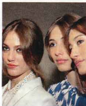
En el backstage del último desfile de la marca Lupe.