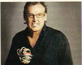
Benito Fernández fashion y solidario.

La moda se unió a través de twitter para la campaña #ayudarestendencia a beneficio de la Fundación Conin, contra la desnutrición infantil. Para colaborar, hay que comprar pulseras hechas en telas recicladas. Se venden por Facebook y se sumaron para colaborar Benito Fernández, entre otras celebridades.