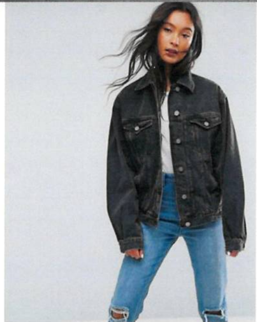
Diseñador y/o marca de referencia: Levi's