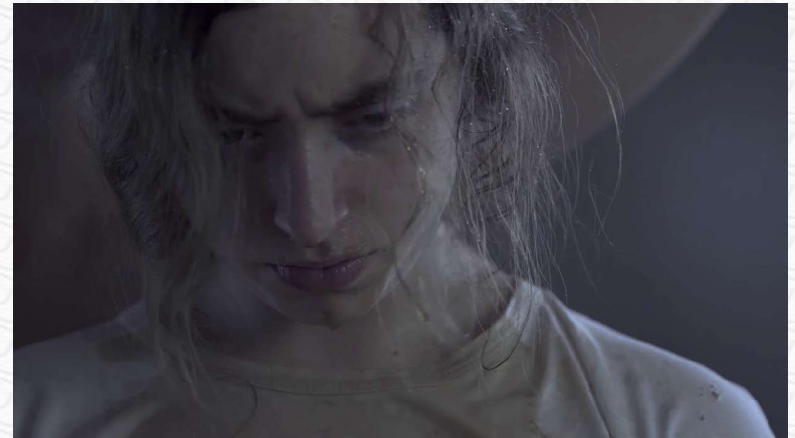
SOLEDAD Tímida Culposa Triste Desmotivada