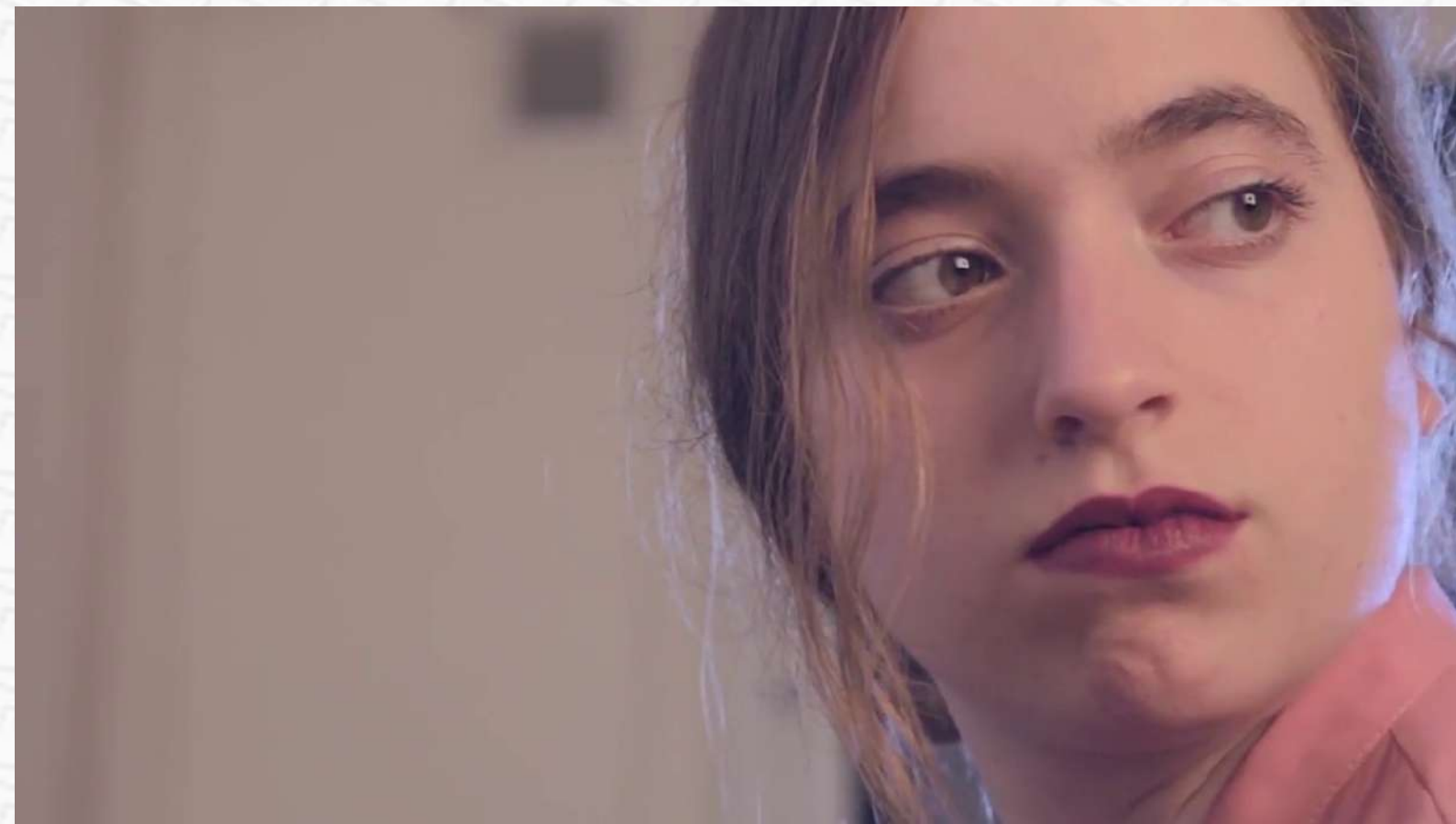
MARINA Mediadora Estructurada Responsable Inestable