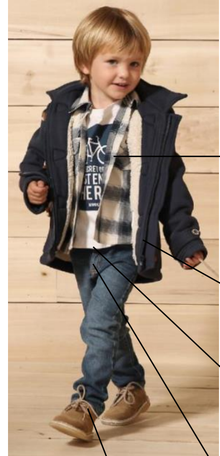
Mimo & Co