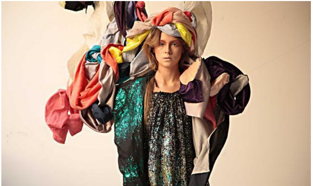
Figura 1 Diseño de Jessica Trosman, disponible en:

Todo el desarrollo generado por esta marca impactó de manera favorable en el mercado local abría las puertas a la moda Argentina a ser vista y valorada en el resto del mundo. (Jessica Trosman, 2002)