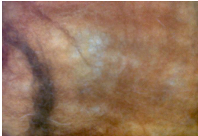
Figura 3. Fielto artesanal.

Para las prendas de la colección se desarrolló fieltro artesanal con base natural y lana teñida con tintes naturales generando una textura inspirada en el panel conceptual ( ver figura 1 cuerpo c)