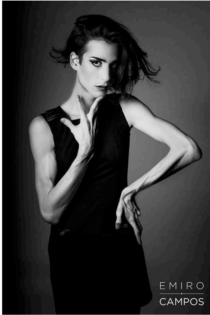
Figura 9: Minnie (2015) [ elaboración propia ]