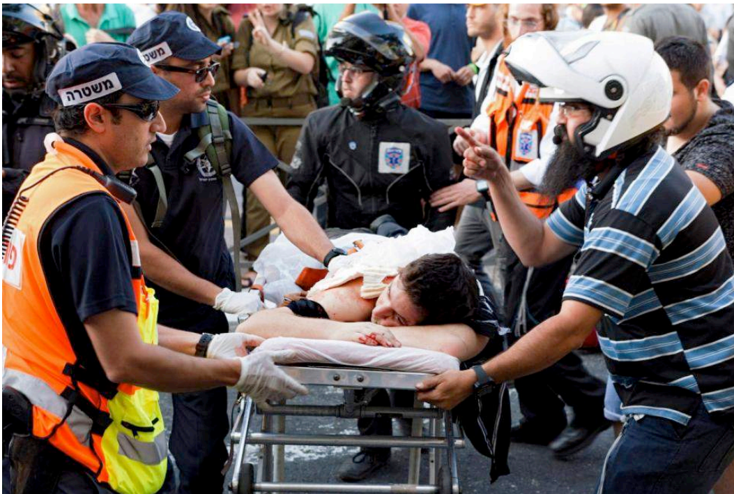
Figura 7: s/t. Fuente: REUTERS. (2015). People disarm an Orthodox Jewish assailant shortly after he stabbed participants at the annual Gay Pride parade in Jerusalem July 30, 2015. REUTERS/Amir Cohen. Recuperado el 26 de Septiembre de 2015 de: http://www.reuters.com/news/picture/jerusalem-gay-pride-attack?articleId=USRTX1MGGX