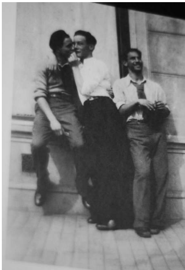
Figura 4: Página 36. Fuente: Ayçaguer, M. (2012). Entre Machos . Buenos Aires: Olmo Ediciones [ elaboración propia ]