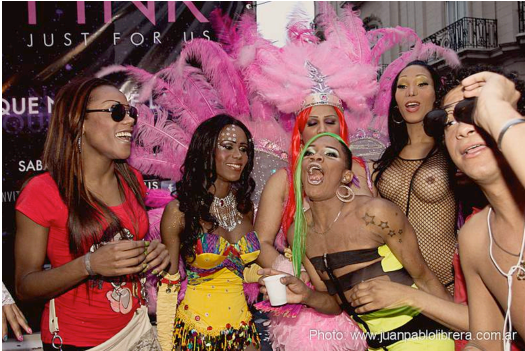
Figura 8: s/t.