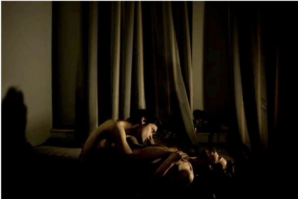
Figura 9: Contemporary Issues, first prize singles. Fuente: World Press Photo (2014). Mads Nissen . Recuperado el 26 de Septiembre de 2015 de: http://www.worldpressphoto.org/collection/photo/2015/contemporary-issues/mads-nissen