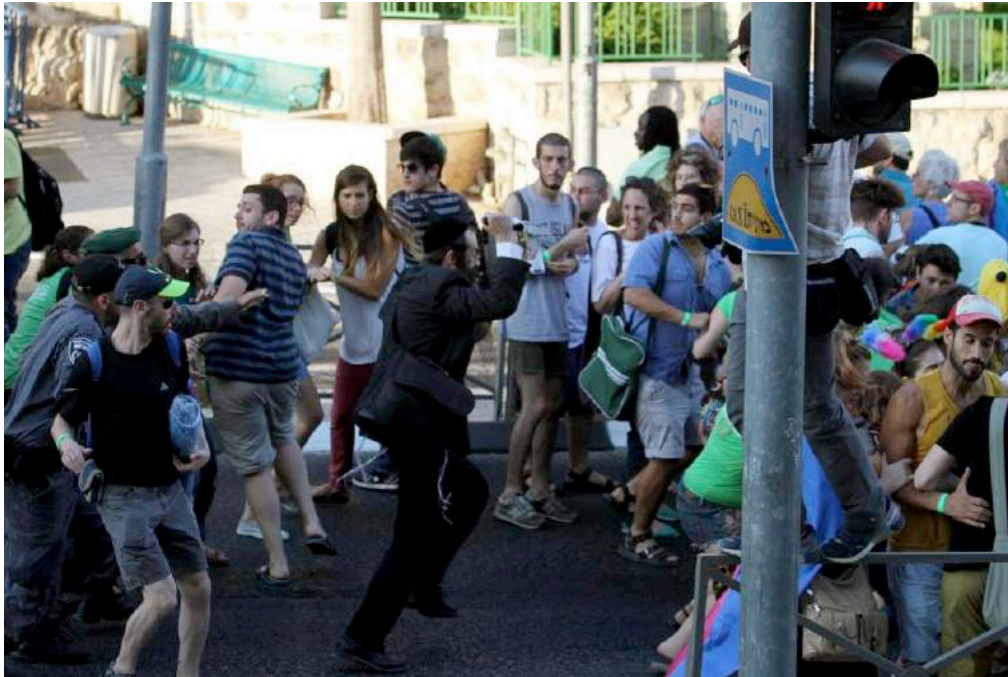
Figura 6: s/t.