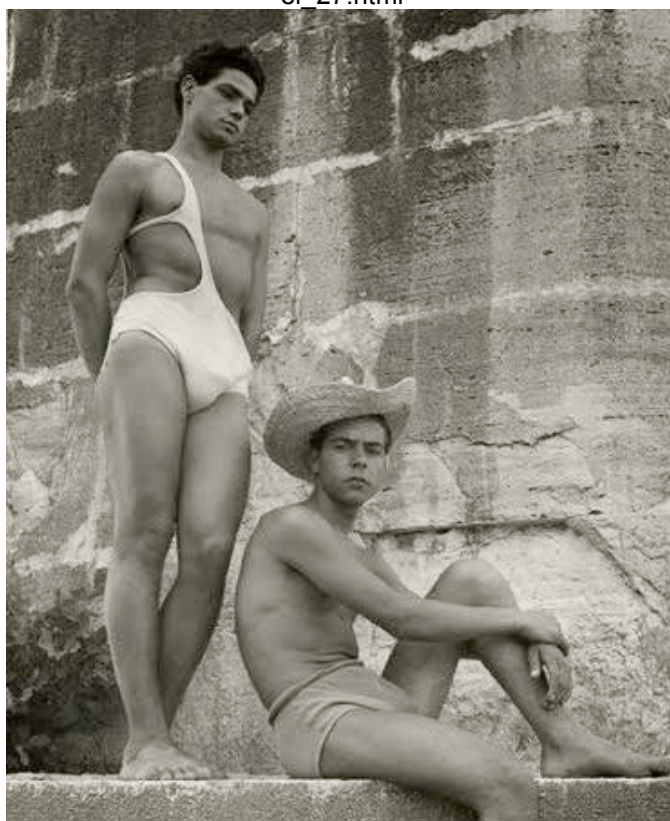
Figura 2: Dos muchachos vistos en el Tíbet, 1950.