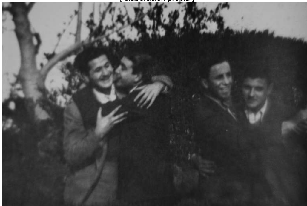
Figura 5: Página 37. Fuente: Ayçaguer, M. (2012). Entre Machos . Buenos Aires: Olmo Ediciones [ elaboración propia ]