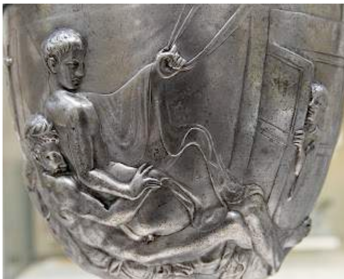
Figura 1: La Copa de Warren.